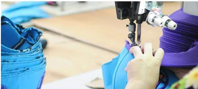
SEAMING & STITCH LINES