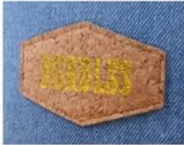
PRINT CORK PATCH