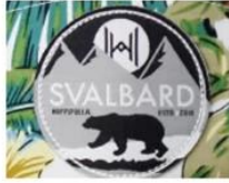
WOVEN KABEK PATCH/ PRINT LABEL PATCH