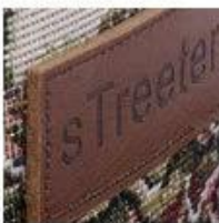
Soft Rubber Patch