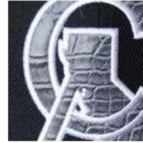
Embroidered Leather Patch