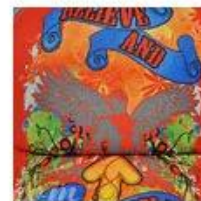
Heat Transfer Printing