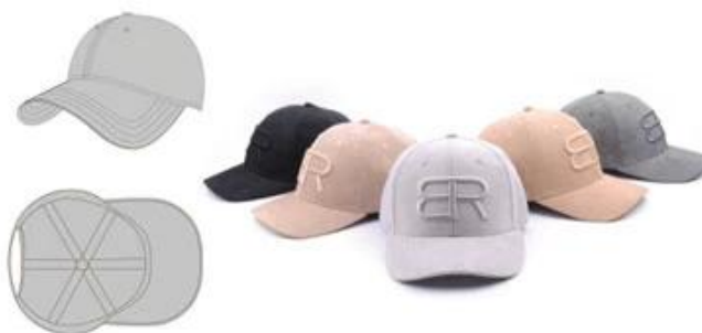
SHOWN STRUCTURED 6 PANEL FLAT BILL 100% POLYESTER 3D EMBROIDERED