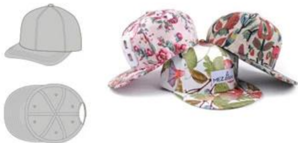
SHOWN-STRUCTURED 6PANEL | FLAT BILL ACRYLIC | LEATHER LABEL