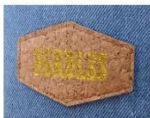
PRINT CORK PATCH