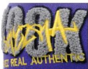
APPLIQUE WITH TOWEL