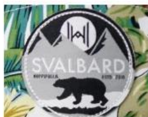
WOVEN KABEK PATCH/ PRINT LABEL PATCH