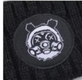
WOVEN LABEL & MERROWED EDGE HIGH DETAIL | RAISED MERROWED EDGING