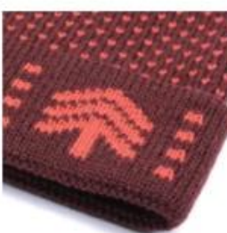
JACQUARD KNIT WOVEN TEXT OR GRAPHICS | ALLOWS FOR CREATIVITY