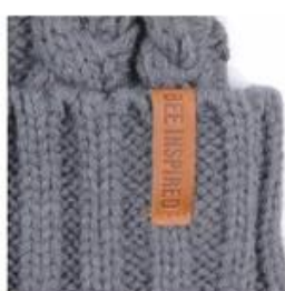
PINCH TAG WOVEN | SIZE AND SHAPE MAY VARY