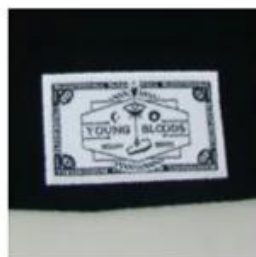
WOVEN LABEL HIGH LEVEL OF DETAIL | SEWN DIRECTLY TO FABRIC