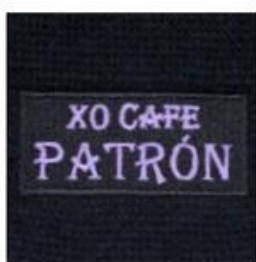
EMBROIDERED PATCH 100% EMBROIDERED PATCH | MERROWED EDGE