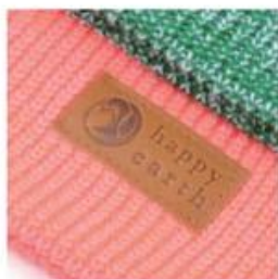
SUEDE/LEATHER FULLY STAMPED LEATHER OR SUEDE

Customize your beanie with your personal branding or artwork. Choose from any of these styles and get creative with your design.