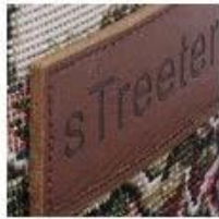
Soft Rubber Patch