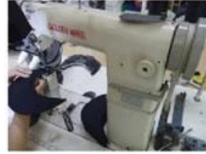
Special Streamlined Lockstitch Machine