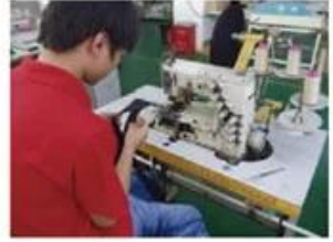
Sweatband Processing Machine