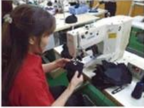
Eyelet Embroidering Machine