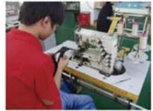
Sweatband Processing Machine