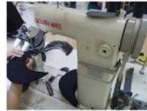
Special Streamlined Lockstitch Machine