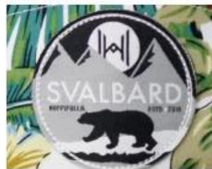
WOVEN KABEK PATCH/ PRINT LABEL PATCH