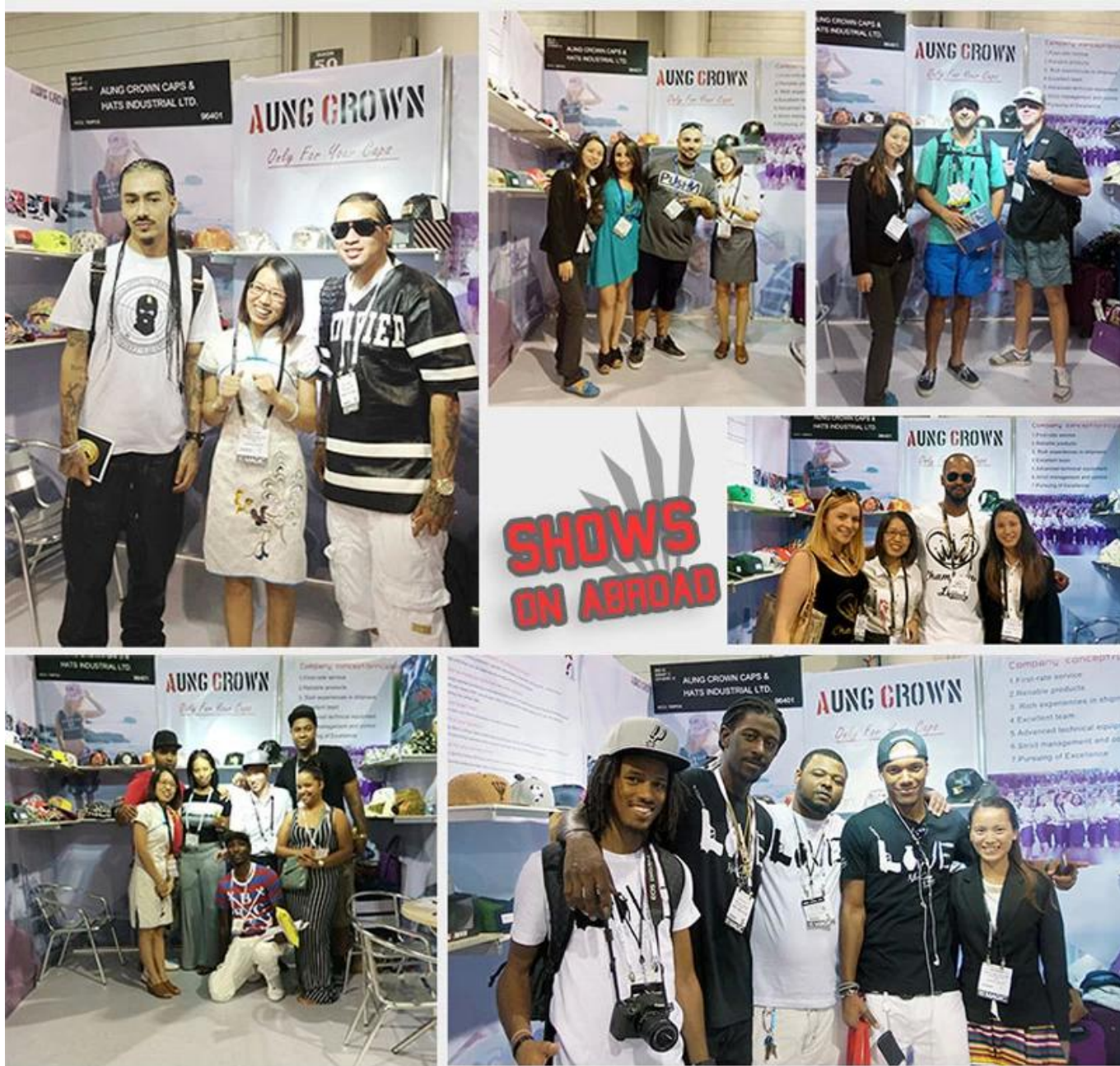
Boné de campo personalizado de 5 painéis , Atacado em branco 5 chapéus snapback painel , Empresa de chapéu personalizado com 5 painéis