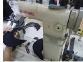
Special Streamlined Lockstitch Machine