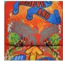
Heat Transfer Printing