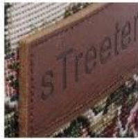
Soft Rubber Patch