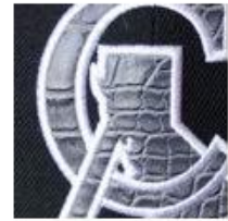
Embroidered Leather Patch