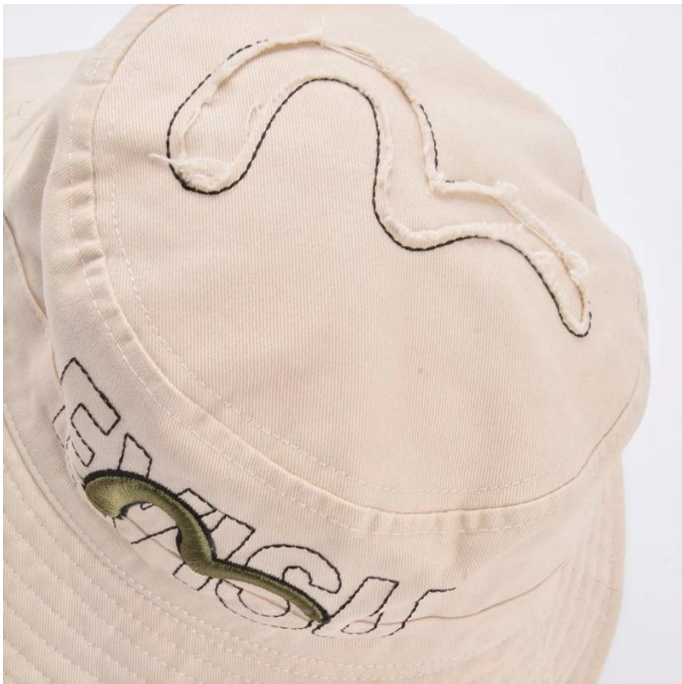
Andere bucket hat modellen die je misschien leuk vindt