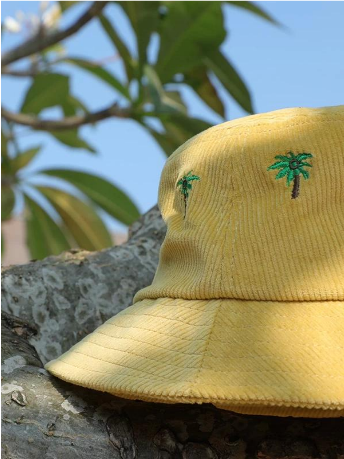
Andere bucket hoed modellen die je misschien leuk vindt