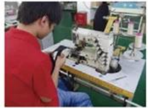
Sweatband Processing Machine