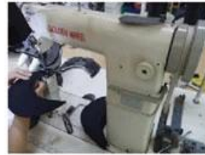
Special Streamlined Lockstitch Machine