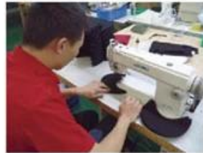
Edge Trimming Machine