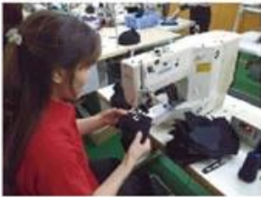
Eyelet Embroidering Machine