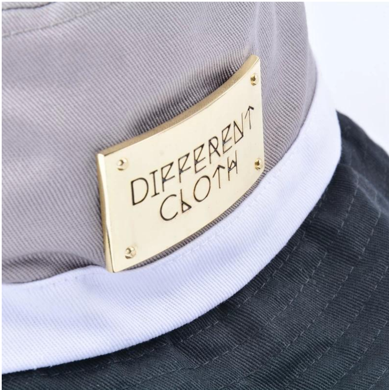
Andere bucket hat modellen die je misschien leuk vindt