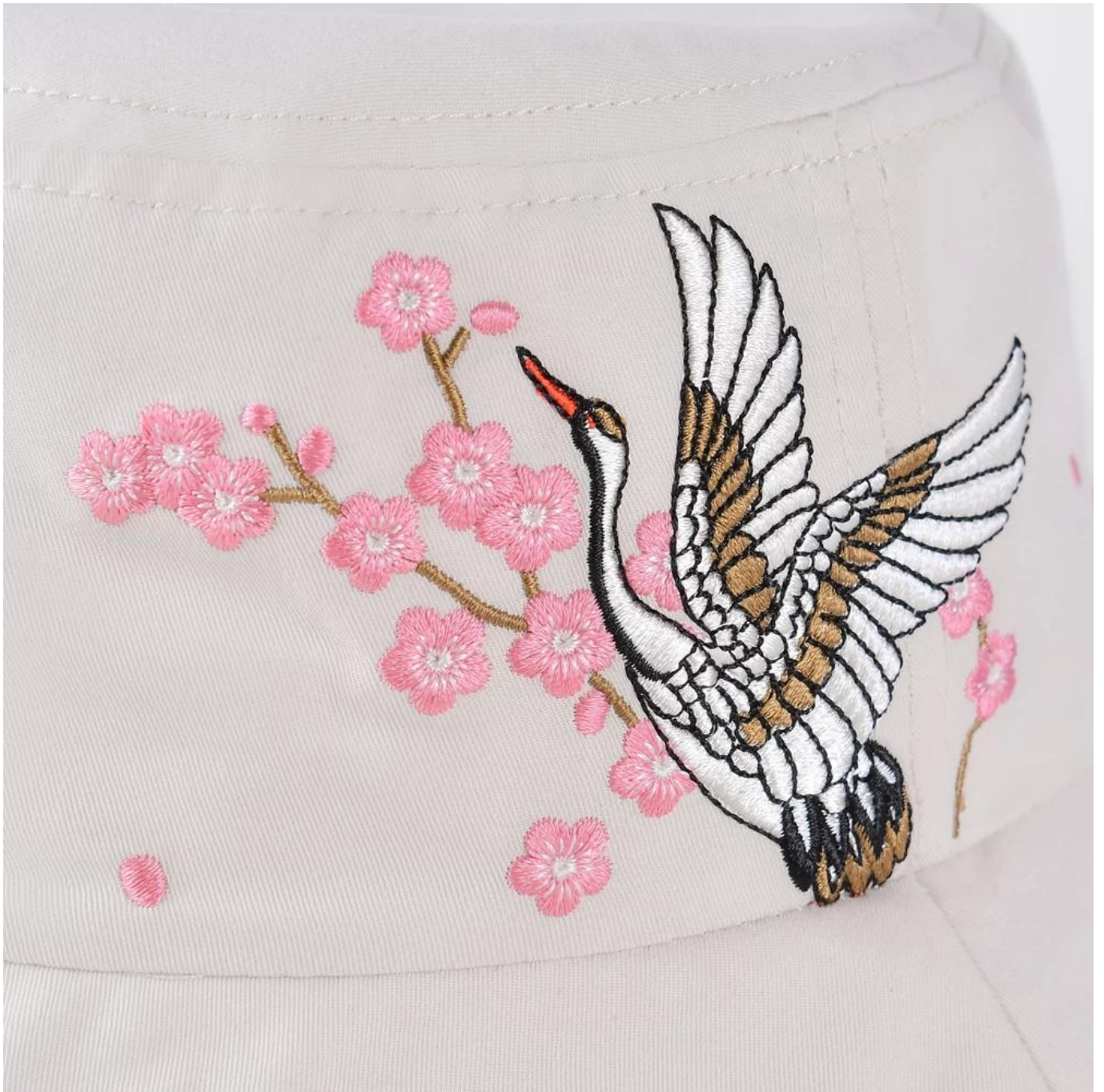
Andere bucket hoed modellen die je misschien leuk vindt