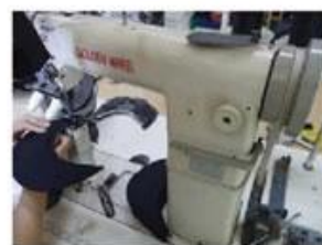
Special Streamlined Lockstitch Machine