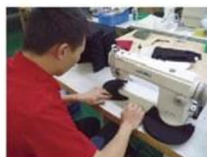
Edge Trimming Machine