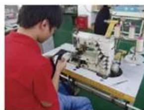
Sweatband Processing Machine