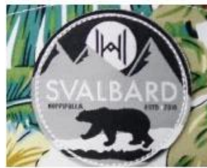
WOVEN KABEK PATCH/ PRINT LABEL PATCH