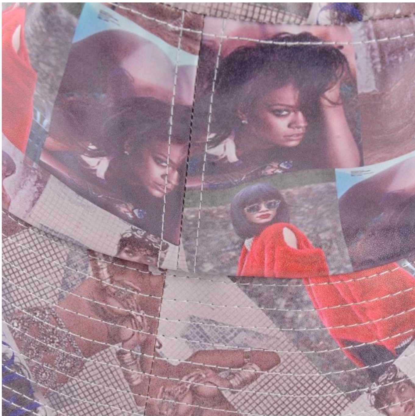
Andere bucket hat modellen die je misschien leuk vindt