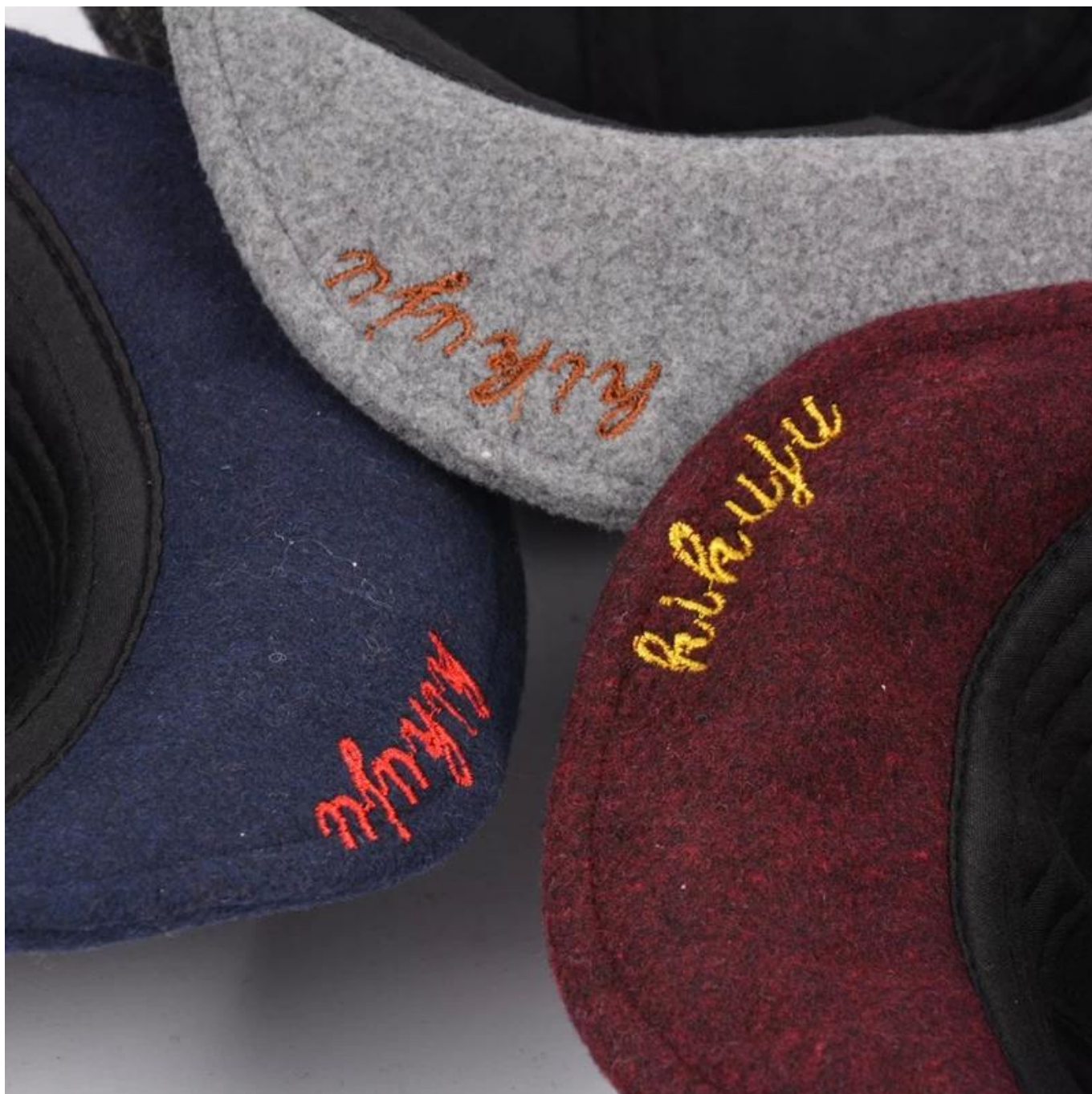
Andere baby hoed modellen die u misschien leuk vindt