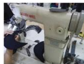
Special Streamlined Lockstitch Machine