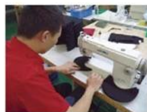
Edge Trimming Machine