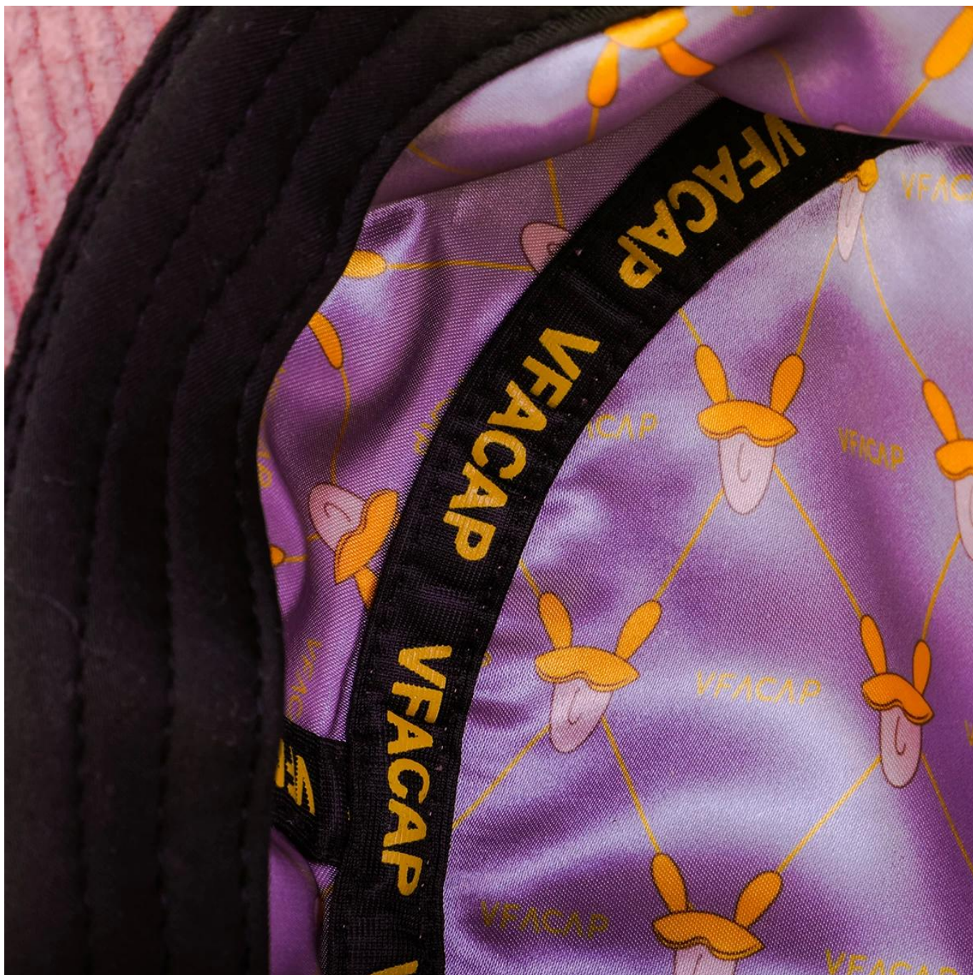
Altro buckequello modelli che potrebbero piacerti