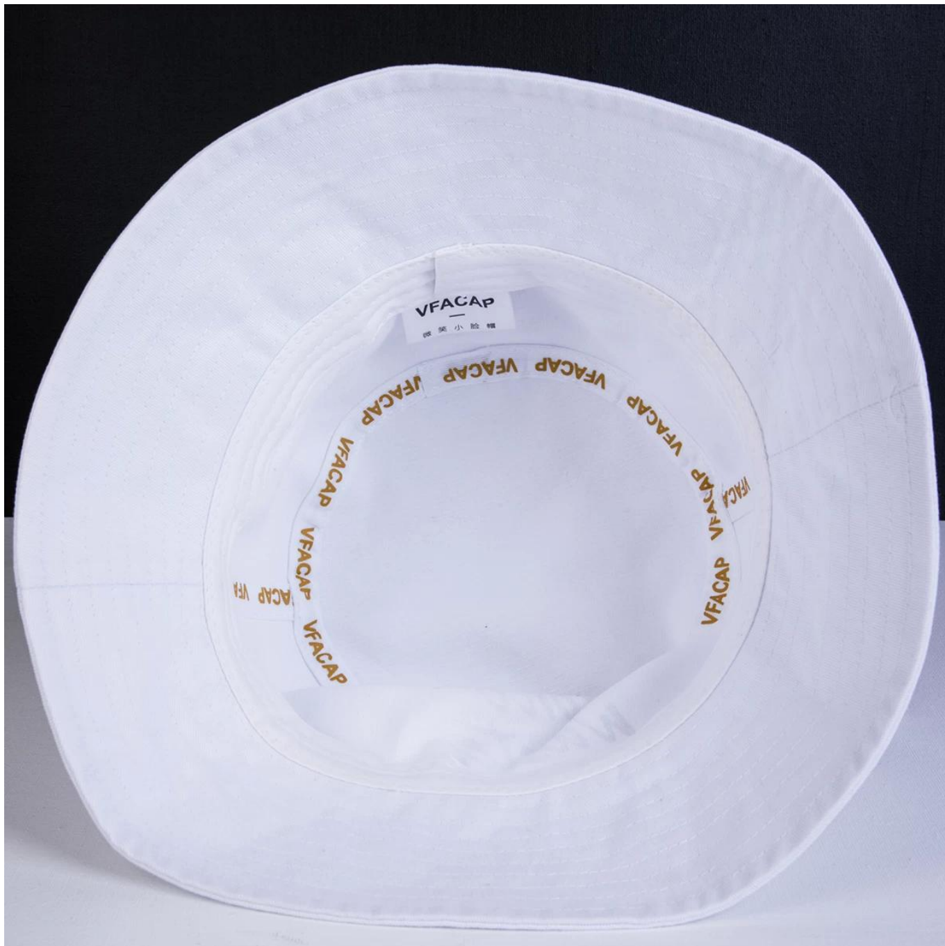
Altro buckequella modelli che potrebbero piacerti