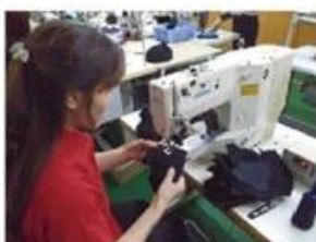
Eyelet Embroidering Machine