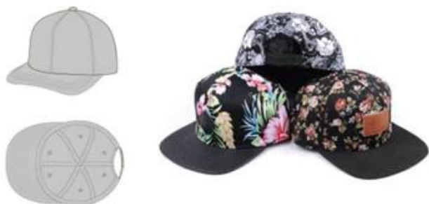
SHOWN STRUCTURED 6 PANEL FLAT BILL 100% POLYESTER 3D EMBROIDERED