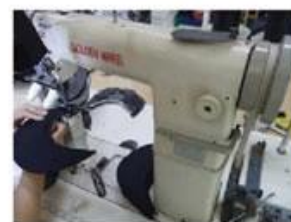
Special Streamlined Lockstitch Machine