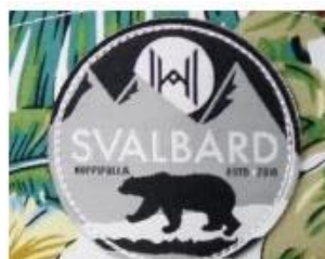
WOVEN KABEK PATCH/ PRINT LABEL PATCH