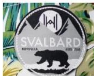
WOVEN KABEK PATCH/ PRINT LABEL PATCH