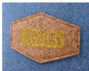
PRINT CORK PATCH