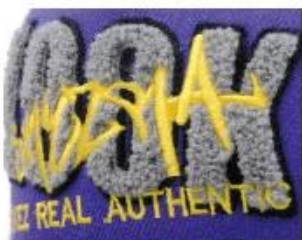
APPLIQUE WITH TOWEL