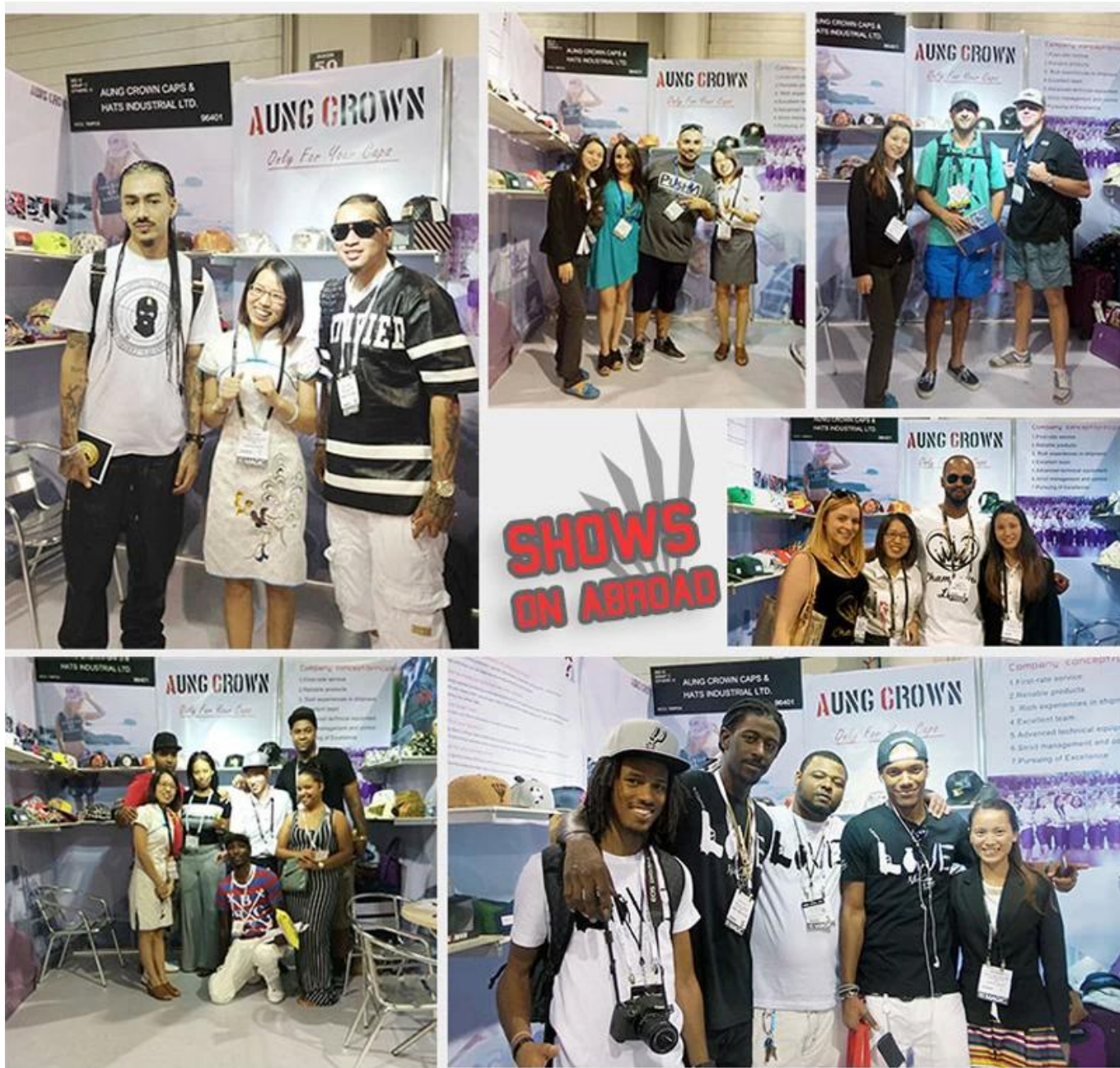
Σχεδιασμός τη δική σας snapback ΚΓΠ Κίνα, 100% Ακρυλικό snapback καπάκι, χονδρικής έθιμο κεντημένα snapback καπέλα