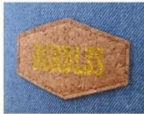
PRINT CORK PATCH