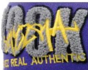
APPLIQUE WITH TOWEL