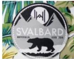
WOVEN KABEK PATCH/ PRINT LABEL PATCH