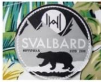
WOVEN KABEK PATCH/ PRINT LABEL PATCH