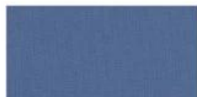
NYLON Tough lightweight synthetic fiber based fabric, durable and flexible