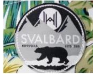
WOVEN KABEK PATCH/ PRINT LABEL PATCH