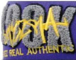
APPLIQUE WITH TOWEL