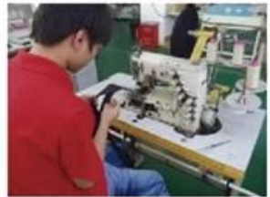
Sweatband Processing Machine