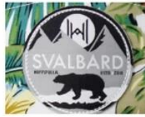
WOVEN KABEK PATCH/ PRINT LABEL PATCH