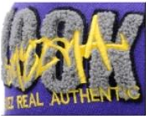
APPLIQUE WITH TOWEL