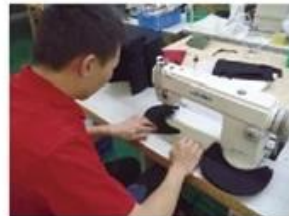
Edge Trimming Machine