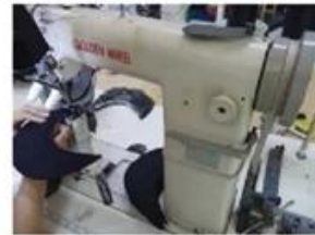
Special Streamlined Lockstitch Machine