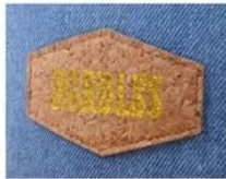
PRINT CORK PATCH