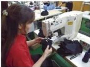
Eyelet Embroidering Machine