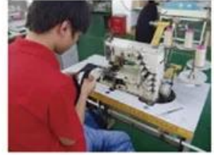
Sweatband Processing Machine