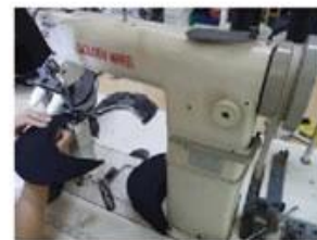
Special Streamlined Lockstitch Machine