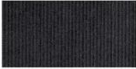
CORDUROY Thick cotton fabric with velvety ribs