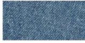
DENIM Ultra-thick cotton twill patterned fabric. Same material as blue jeans