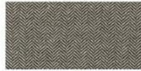
HERRINGBONE Classic wool patterned fabric. Great for any hat