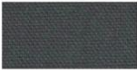
COTTON CANVAS Strong, rough, tightly woven cotton fabric