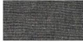
ACRYLIC Synthetic fiber based fabric. Often used for bucket hats