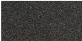
FOAM Soft porous material commonly used for sublimation or heat press.