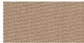
POLY-TWILL Polyester fabric woven with diagonal parallel ridges