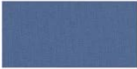
NYLON Tough lightweight synthetic fiber based fabric, durable and flexible