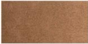
SUEDE Soft leather with a napped exterior surface