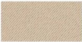
COTTON TWILL Cotton fabric woven with diagonal parallel ridges