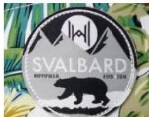
WOVEN KABEK PATCH/ PRINT LABEL PATCH