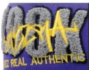
APPLIQUE WITH TOWEL