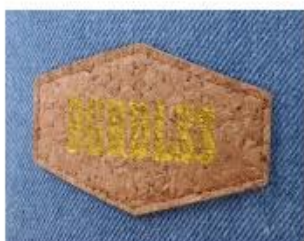
PRINT CORK PATCH