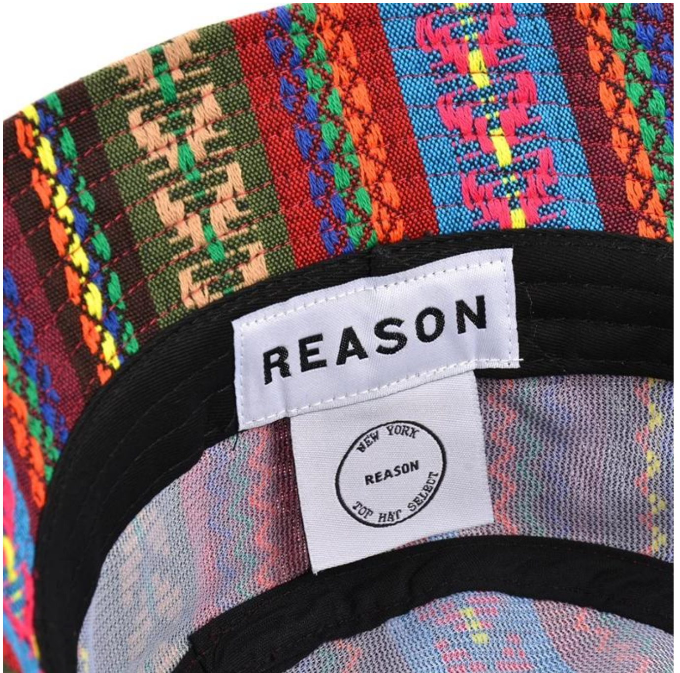
Otro buckeese modelos que te pueden gustar