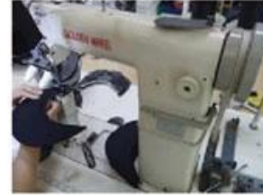
Special Streamlined Lockstitch Machine