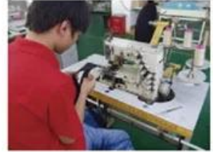
Sweatband Processing Machine