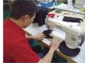
Edge Trimming Machine