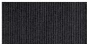
CORDUROY Thick cotton fabric with velvety ribs