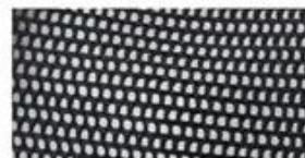
TRUCKER MESH Choose between firm or soft mesh as an option for any of the panels.