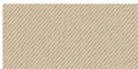
COTTON TWILL Cotton fabric woven with diagonal parallel ridges