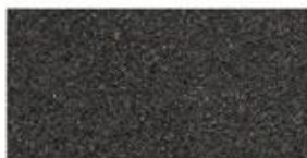
FOAM Soft porous material commonly used for sublimation or heat press.