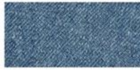
DENIM Ultra-thick cotton twill patterned fabric. Same material as blue jeans