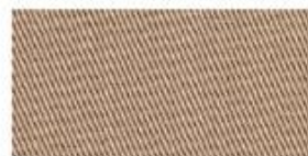
POLY-TWILL Polyester fabric woven with diagonal parallel ridges