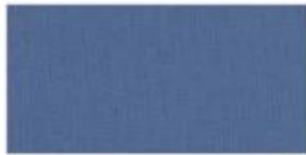
NYLON Tough lightweight synthetic fiber based fabric, durable and flexible