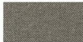
HERRINGBONE Classic wool patterned fabric. Great for any hat