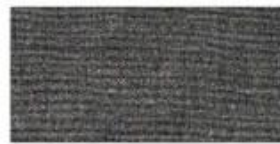
ACRYLIC Synthetic fiber based fabric. Often used for bucket hats