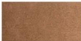
SUEDE Soft leather with a napped exterior surface