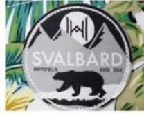
WOVEN KABEK PATCH/ PRINT LABEL PATCH