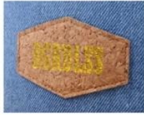
PRINT CORK PATCH