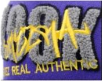
APPLIQUE WITH TOWEL