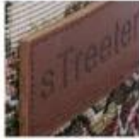
Soft Rubber Patch