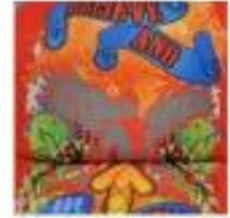
Heat Transfer Printing