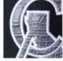
Embroidered Leather Patch