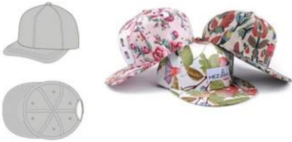
SHOWN-STRUCTURED 6PANEL | FLAT BILL ACRYLIC | LEATHER LABEL