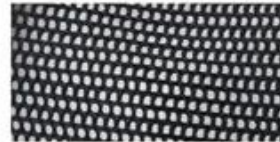
TRUCKER MESH Choose between firm or soft mesh as an option for any of the panels.