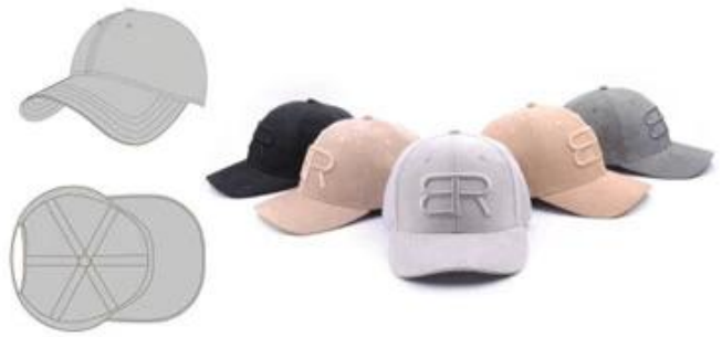
SHOWN STRUCTURED 6 PANEL FLAT BILL 100% POLYESTER 3D EMBROIDERED