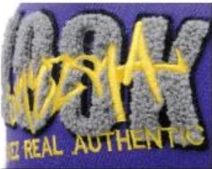
APPLIQUE WITH TOWEL