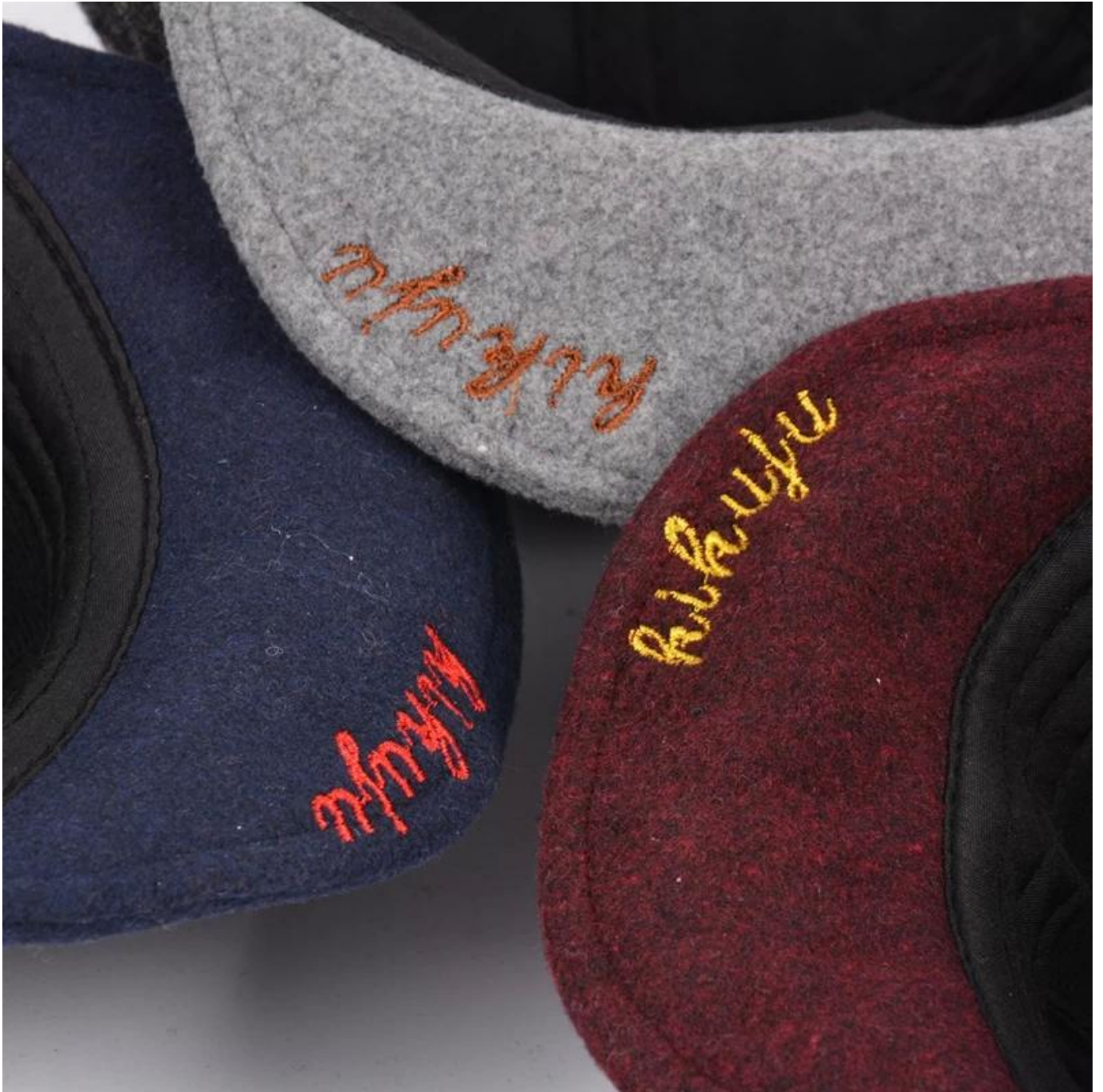
Anderes Baby Hut Modelle, die Ihnen gefallen könnten